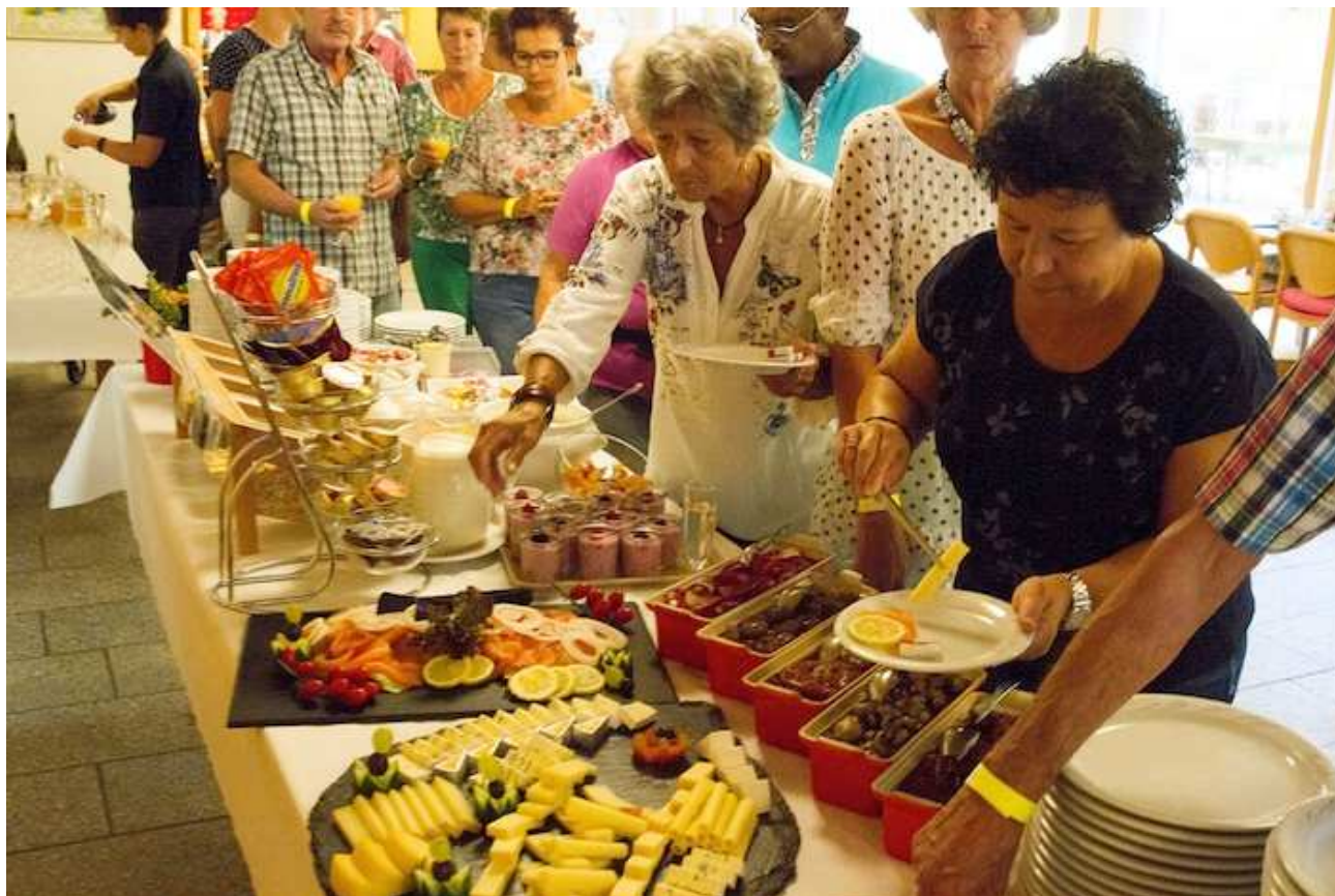
Das Gourmet- und Jazzangebot zog zahlreiche Besucher an.