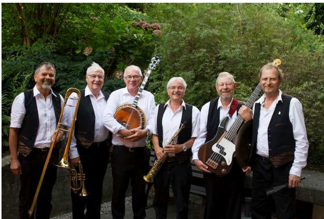
Die Red Point Jazz spielte zum ersten Mal im Altersheim Sunnsyta.

Zum ersten Mal verband das Altersheim Sunnsyta seinen Brunch mit Musik. Während die Küche zur Hochform aufrief und kulinarische Leckereien auftrug, spielte die Red Point Jazz Band auf. 140 Personen nutzten das Angebot